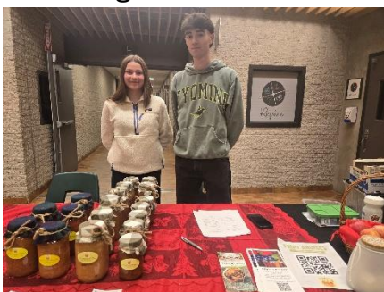
L'équipe de Fruit'andises du Cégep de St-Félicien a donné les profits des ventes du marché de Noël à la Soupe populaire.