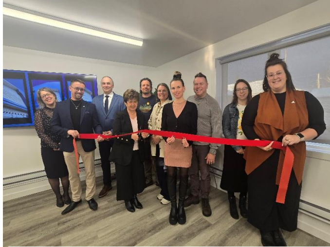
Photo prise lors de l'inauguration officielle du 1250.

Depuis le legs testamentaire reçu en juin 2024, les administrateurs et moi savions que nos responsabilités augmenteraient, le temps de trouver le local « parfait » et de réaliser les travaux. Déjà très actifs dans la recherche de financement, la directrice adjointe et moi avons multiplié les démarches afin d'obtenir de nouvelles subventions, tout en poursuivant notre mission quotidienne. L'année s'annonçait donc chargée avant même de commencer. Fidèles à nos habitudes, nous avons relevé les défis un jour à la fois et le déménagement a eu lieu comme prévu à la fin de septembre.