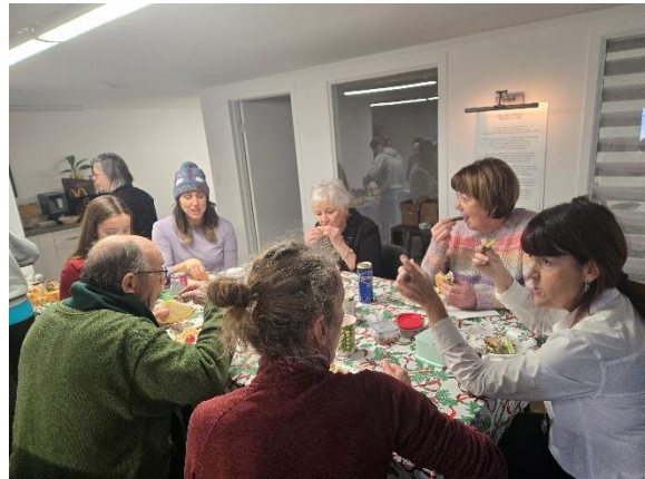
Des bénévoles et membres de l'équipe pendant le dîner de la Guignolée.