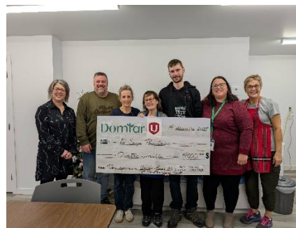
Unifor local 24Q est un généreux donateur pour la soupe populaire