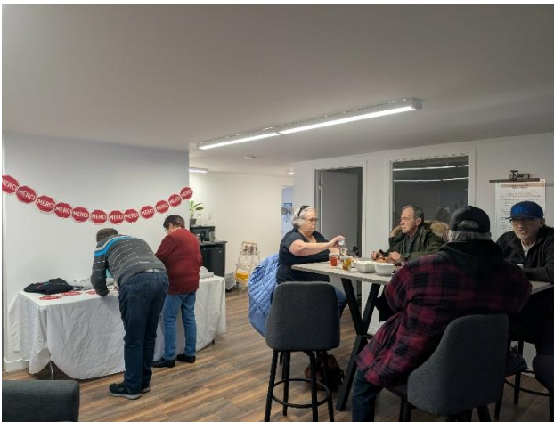
Les employés et les bénévoles du CAB à l'occasion d'une activité porte ouverte dans nos nouveaux locaux dans le cadre de la JIB