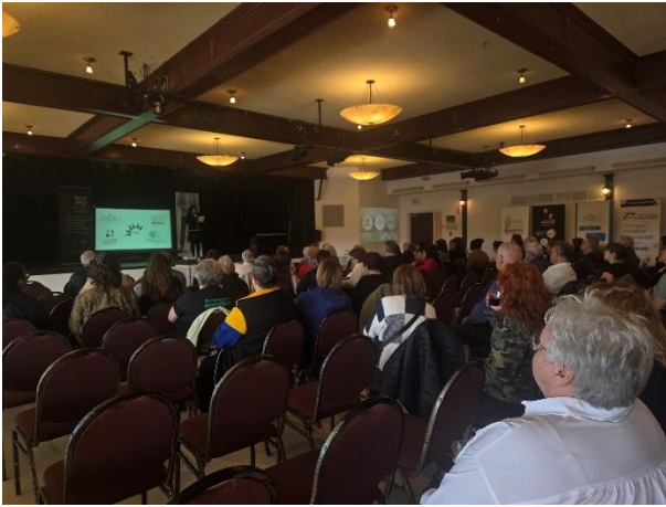
Les CABS et des bénévoles de toute la région se sont rassemblés à la Dam-en-Terre d'Alma pour un 5 à 7 conférence.