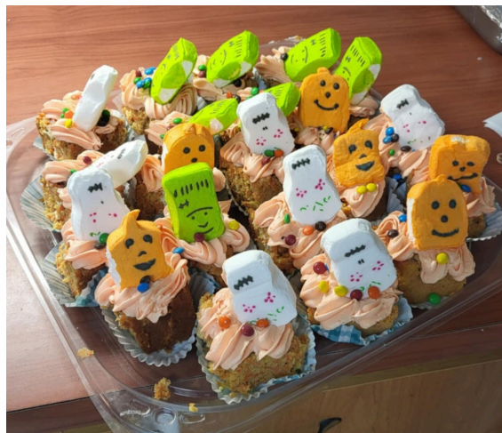
Le dîner d'Halloween à la Soupe populaire est toujours un attendu avec impatience!