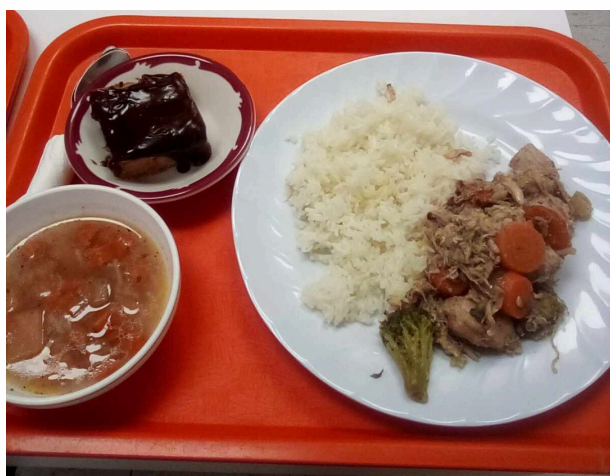
Le dîner du Marché d'ici et d'ailleurs