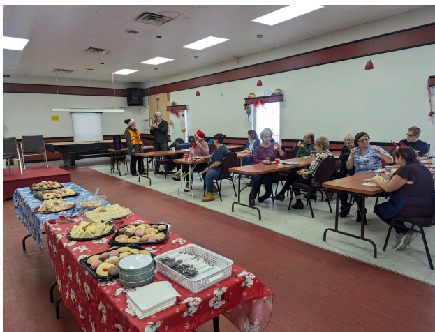
Toute la journée, les bénévoles étaient invités à se joindre à l'équipe à la Soupe populaire