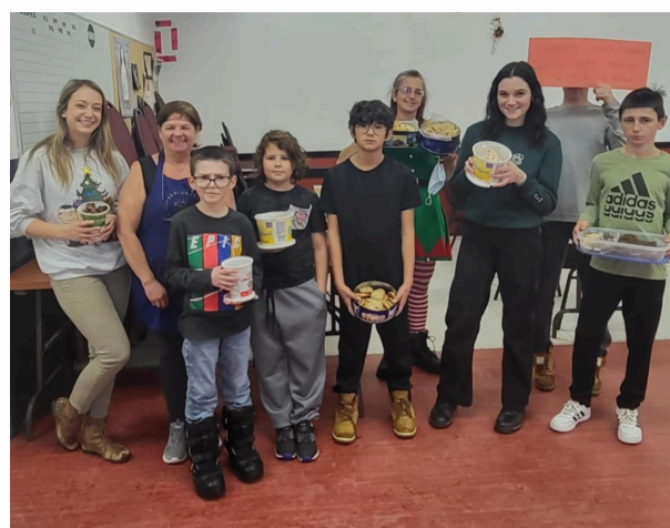
Comme à chaque année, la classe des kangourous de l'école Mgr Bluteau prépare des desserts et les remet à la Soupe