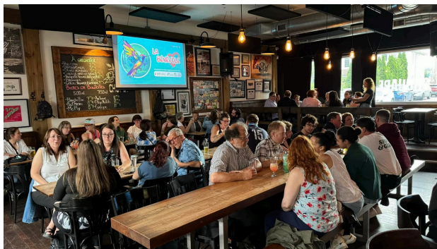
Le coup d'envoi du colloque s'est fait à la microbrasserie La Chouape de St-Félicien

En juin 2024, la région du Saguenay-Lac -Saint-Jean a reçu les centres d'action bénévole du Québec dans le cadre du colloque annuel de la FCABQ qui a eu lieu du 10 au 13 juin à Saint-Félicien. Le CAB DDR, en tant que CAB hôte, faisait évidemment partie du comité organisateur avec les autres CAB de la région et des membres de la permanence de la FCABQ.