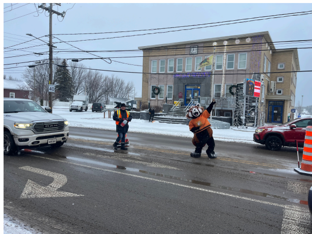
Des bénévoles du zoo avec leur mascotte