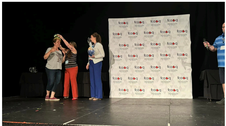
À la fin du colloque, un bleuét honorifique a été nommé après un quiz sur la région